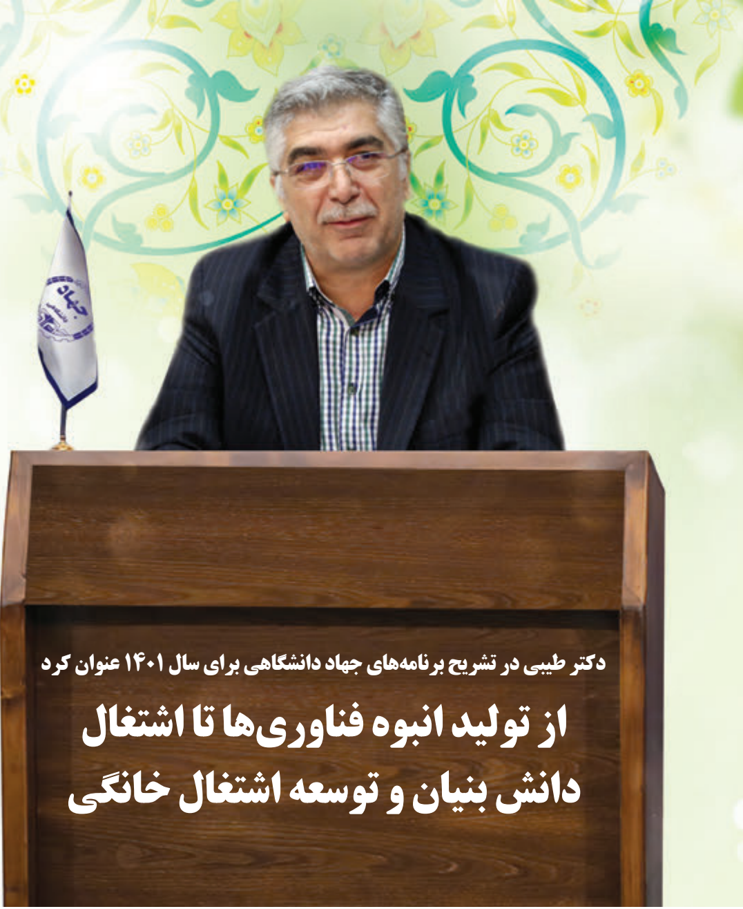
دکتر طیبی در تشریح برنامه‌های جهاد دانشگاهی برای سال ۱۴۰۱ عنوان کرد

رییس جهاددانشگاهی افزود: متأسفانه نه در این دهه و نه در دهه‌های قبل برنامه منسجم و دراز مدتی برای رفع وابستگی و توسعه تولید ملی با اتکاء بر فناوری‌های پیشرفته بومی وجود نداشته است. اینکه ما در جهاددانشگاهی و با سایر شرکت‌های دانش بنیان با سایر سازمان‌ها اعلام می‌کنند که برای اولین بار موفق به کسب دانش فنی و ساخت یک محصول و با ارائه یک خدمت در کشور شدند، زمانی ارزشمند است که این محصولات تولید انبوه شده هم نیاز ملی را تأمین کنند و هم به صادرات منجر شوند، استفاده از توان ملی باید متناسب با تأکیدات رهبر معظم انقلاب برای تحقق